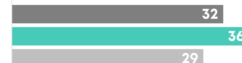
■ Bevölkerung ■ BILD ■ regionale Abo-Zeitungen

planen und buchen ihren Urlaub 2-3 Monate im Voraus